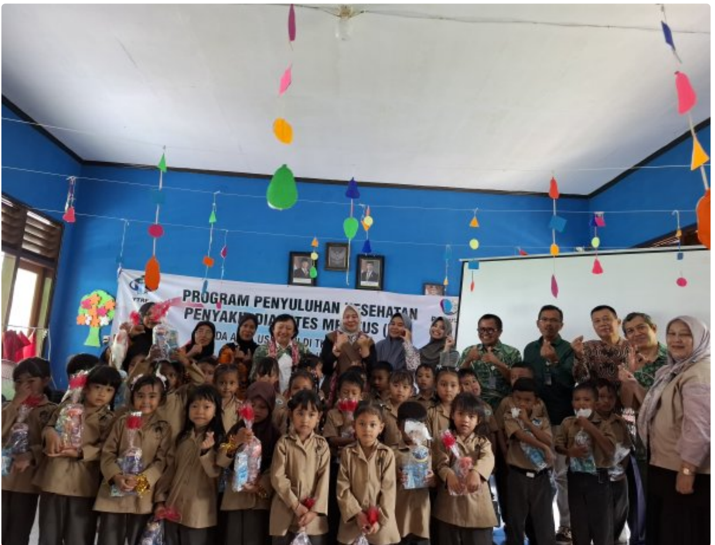
Foto bersama Yayasan Taruna Rimba Pusat dan TK Tunas Rimba Perhutani Cabang Indramayu,

Indramayu. Dalam rangka upaya menciptakan generasi yang cerdas dan sehat, Perhutani Kesatuan Pemangkuan Hutan (KPH) Indramayu mendukung kegiatan penyuluhan kesehatan penyakit Diabetes Melitus (DM) pada anak usia dini. Kegiatan yang di selenggarakan oleh Yayasan Taruna Rimba Pusat berlangsung