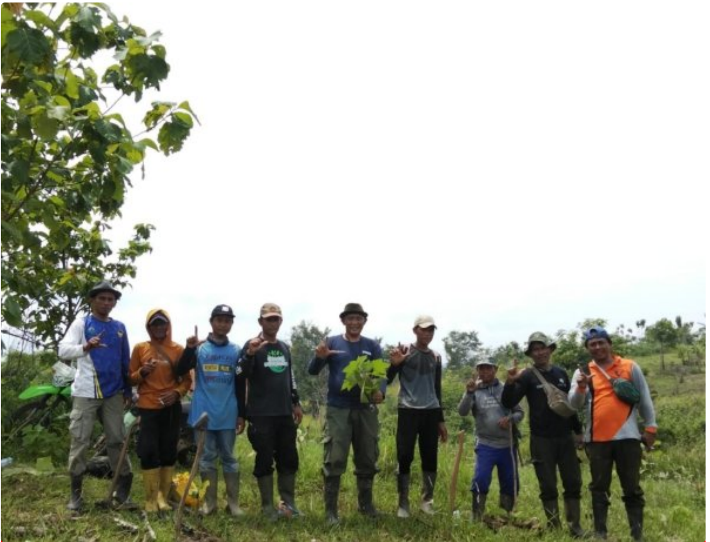
Penanaman bersama wilayah BKPH Cikawung KPH Indramayu

Indramayu. Dalam rangka memperingati Hari Menanam Pohon Indonesia (HMPI) Perhutani Kesatuan Pemangkuan Hutan (KPH) Indramayu bersama stakeholder melakukan penanaman pohon dengan jenis Jati Plus Perhutani (JPP) sebanyak 1242 plances. Kegiatan tersebut berlangsung di bukit Cikawung petak 16b Resort Pemangkuan Hutan (RPH) Cikawung, Bagian Kesatuan Pemangkuan Hutan (BKPH) Cikawung, wilayah administrative Desa Cikawung,